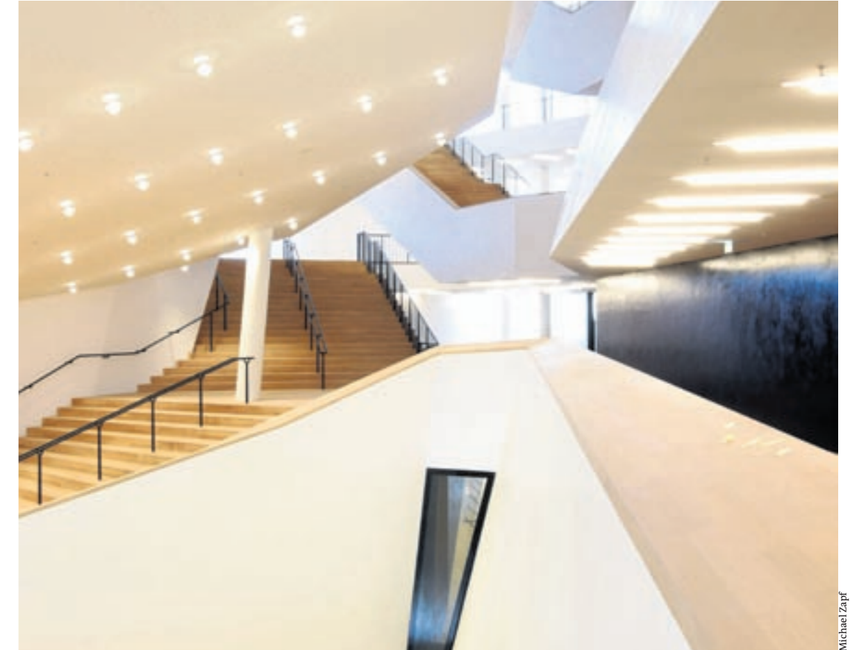
Im Foyer: Die Stufen, die in die »Höhle der Harmonie« führen

Niemand wollte den Jubel stören, es galt, die Ode von der Wiederaufstehung der deutschen Kultur zu singen, schließlich soll das neue Konzerthaus »die Weltspitze der Konzerthäuser« ( Spiegel online ) erklimmen, »ein Juwel der Kulturwelt Deutschland«, wie Bundespräsident Joachim Gauck psalmodierte. Die Eröffnung lief auf allen Kanälen, von NDR über ARD (»Konzerthaus der Superlative« lautete der Titel der Dokumentation) bis zu ZDF, 3sat und Arte. Von kritischer Berichterstattung