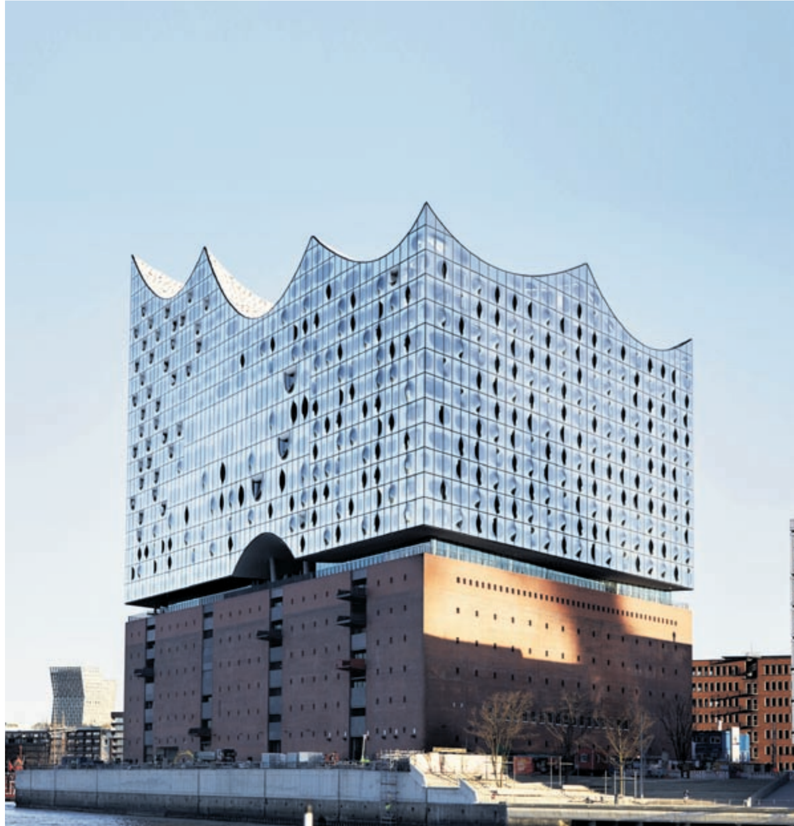
Beruhigung für alle, die nicht vor Ort sein können: Die CD »Elbphilharmonie. The First Recording« ist bereits im Handel erhältlich

Die Elbphilharmonie in Hamburg wurde eröffnet. Von Berthold Seliger