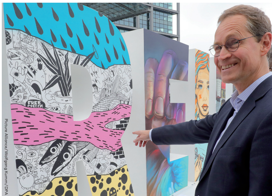
R wie Riesenverarsche: Bürgermeister Michael Müller bei der Eröffnung der Kunstinstallation »#FreiheitBerlin«, Mai 2018

Am 13. März haben die Kulturprojekte Berlin einen »Ideenwettbewerb Brandenburger Tor« ausgeschrieben. »Alleine? Wäre die deutsche Einheit so niemals möglich gewesen«, heißt es in der Vorbemerkung. Gesucht wird »eine besondere Idee zur Inszenierung und künstlerischen Bepielung des Brandenburger Tors unter Einbezug des Platzes des 18. März als Symbol der deutschen und letztlich auch europäischen Einigung anlässlich der zentralen Feierlichkeiten des »Tag der Deutschen Einheit 2018« ... Bei der gesamten